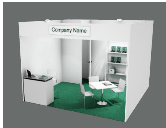
Soluzione 2 lati aperti / Two open sides booth