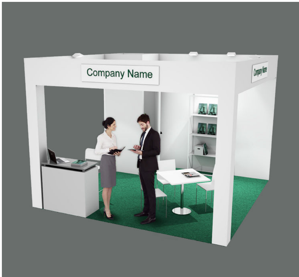
Soluzione 1 lato aperto / One open side booth