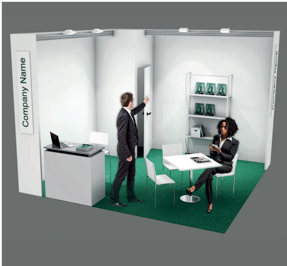
Soluzione 1 lato aperto / One open side booth